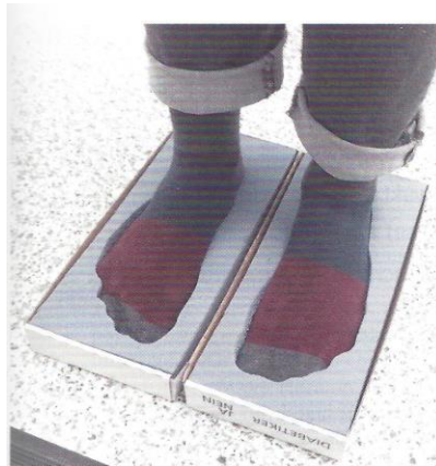
2 Je nach Versorgung werden die Abdrücke teil- oder ganzbelastet abgenommen. Es ist auch nicht unbedingt nötig, dabei die Socken auszuziehen.